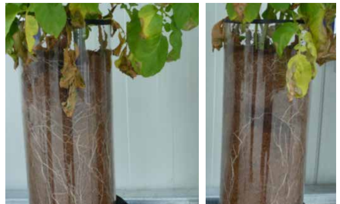
Gefäßversuch: links wurden 10/l ha YaraVita Kombiphos appliziert, rechts kein Blattdünger