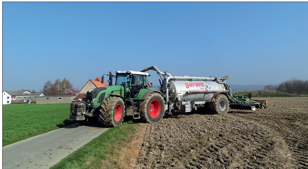
Mittlerweile besteht in der Regierungskoalition ein Konsens darüber, ab 2023 eine verbindliche Stoffstrombilanz, ähnlich der Hoftorbilanz, einzuführen.

Mittlerweile besteht in der Regierungskoalition ein Konsens darüber, ab 2023 eine verbindliche