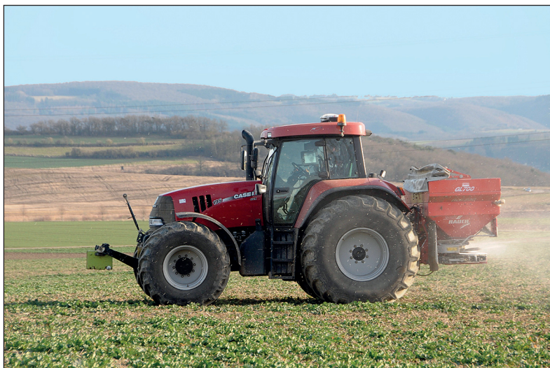
Am meisten Schwefel nimmt der Winterraps auf, weil er hohe Mengen an schwefelhaltigen Inhaltsstoffen, wie etwa Senföle, bildet. Sein Schwefel-Düngerbedarf liegt bei 30 - 50 kg/ha.

Daher sollte darauf geachtet werden, dass im Grünland zur ersten und auch zur zweiten Stickstoffgabe Schwefel über Mineraldünger mit ausgebracht wird, um von Anfang an eine ausreichende Versorgung sicherzustellen. Die beiden ersten Schnitte erbringen schließlich einen Großteil des ge-